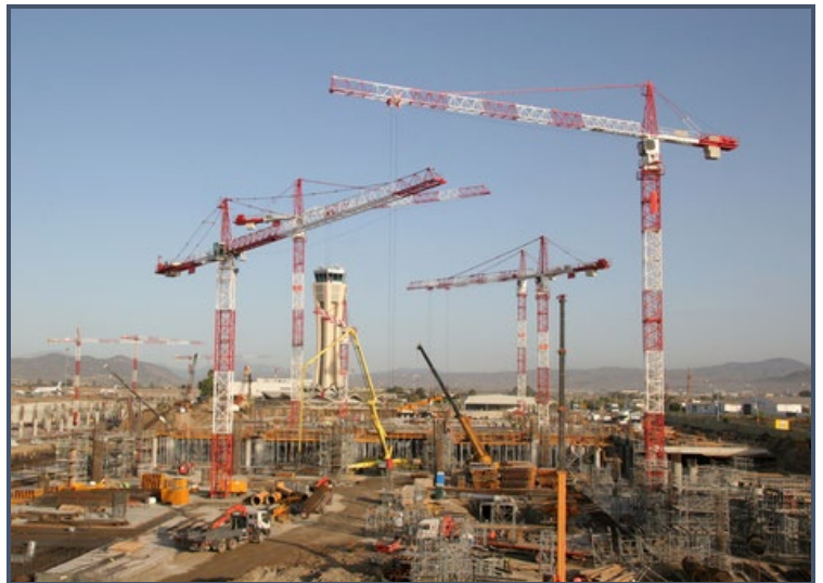
Figuur 2. een foto als voorbeeld van meerdere kranen in elkaars draaibereik in de praktijk in elkaars draaibereik.